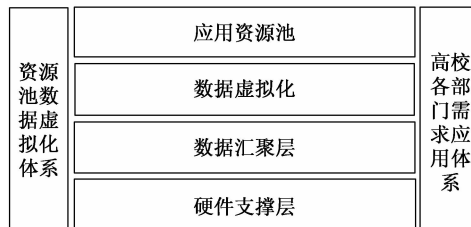
图 1 高校内虚拟资源池整合

池供数据仓库进行过滤提炼, 并用于数据挖掘和决策分析。而数据资源池技术作为一种将数据、服务器, 存储、网络、都整合成一个虚拟的资源池 (如图 1), 这样应用软件需要的资源可以在资源池里抓取, 不仅能够提升高校的服务器资源的利用率、数据可用性, 同时也可以指导高校管理做出科学决策。