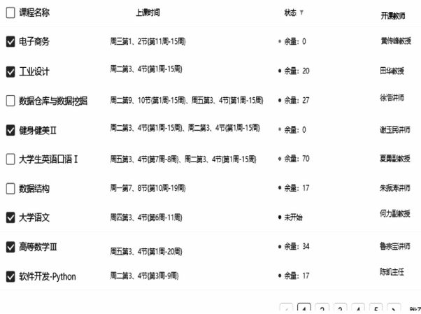
图 4 选课系统前端界面

后端程序在选课前使教务系统中与学工系统冷数据库中的异构数据载入资源池, 通过资源池的数据虚拟化模块整合选课所需关键数据, 并且通过读取前端返回数据进行选课 (如图 4), 在访问量减少时和结束时, 将 Redis 数据迁移到资源池中, 从而完成选课数据的虚拟同构化。