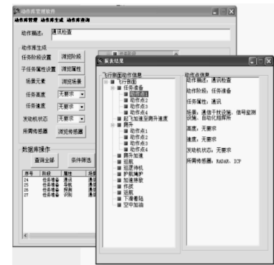
图 1 作战剖面设计软件界面

根据前期规划好的试飞动作点,识别并定义出各动作点的关键属性,并构建动作点数据库。设计智能化的基于动作点关键属性的动作点检索算法,为面向使用的试飞设计提供支持。数据库的内容应该包括试验点所属任务阶段、飞行高度、飞行速度、发动机推力、飞机构型、耗时、动作、配试条件、前置科目要求等等。此外还应包括 COI、MOE、MOP 三者之间的对应关系,及其和各试验点的对应关系,便于进行科目综合。